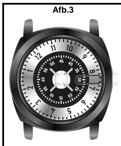
Het is 7u30 of 19u30.