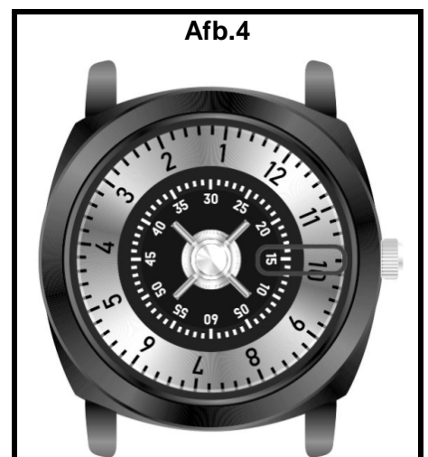
Het is 10u15 of 22u15.