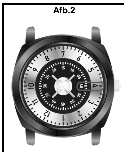
Het is 4u00 of 16u00.

Hieronder ziet u een aantal voorbeelden voor het lezen van de tijd: